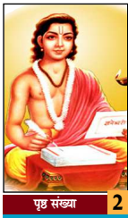
पृष्ठ संख्या 2