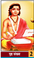
पृष्ठ संख्या 2