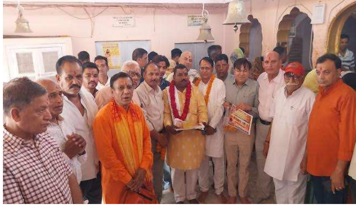
लेकर, मुख्य बाजार होते हुए कथा स्थल श्री मां वैष्णो धाम पहुंचेगी।

17 जून को प्रातः 8:15 बजे से महिलाओं द्वारा विशाल कलश यात्रा निकाली जाएगी, जो प्राचीन शिव बजरंग मंदिर रावण गेट, खादी बाग रोड से रवाना