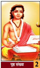
पुष्प संख्या 2