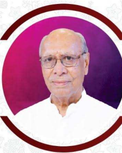
उन्होंने शिक्षा और सामाजिक विकास के क्षेत्र में भी महत्वपूर्ण योगदान दिया। विद्यार्थियों में कक्ष निर्माण, बच्चों को

बढ़ावा देने के लिए अनेक प्रयास किए। उनके समर्पित कार्यों की सराहना राष्ट्रीय स्तर पर भी हुई और खादी एवं ग्रामोद्योग के क्षेत्र में उनके उत्कृष्ट योगदान के लिए उन्हें भारत के राष्ट्रपति एवं प्रधानमंत्री द्वारा सम्मानित किया गया। यह सम्मान उनके जीवन भर के निष्ठापूर्ण सेवा कार्यों का प्रमाण है। राजस्थान खादी संघ में सहायक मंत्री के रूप में उन्होंने दीर्घकाल तक सेवा दी। 1967 में बस्सी क्षेत्र में खादी ग्रामोद्योग संस्था की स्थापना कर उसे निरंतर विकसित किया। एक छोटे से किराए के भवन से आरंभ हुआ कार्य आगे चलकर विशाल आश्रम भवन में परिवर्तित हुआ। जिसकी संपत्ति लाखों से बढ़कर करोड़ तक पहुंची और इससे सैकड़ों लोगों को रोजगार मिला।