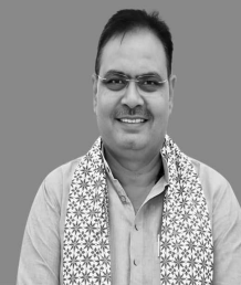
श्री भजनलाल शर्मा माननीय मुख्यमंत्री