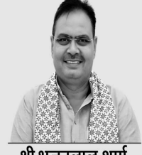
श्री भजनलाल शर्मा माननीय मुख्यमंत्री

2 साल नव उत्थान - नई पहचान बढ़ता राजस्थान - हमारा राजस्थान