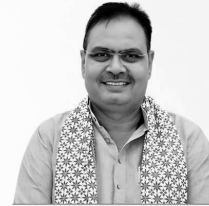
श्री भजनलाल शर्मा माननीय मुख्यमंत्री

2 साल नव उत्थान - नई पहचान बढ़ता राजस्थान - हमारा राजस्थान