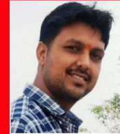
विनोद शर्मा वेणु, नेहरू, लीकर

करीने से सजा कर रखें हैं मैंने बीते वक्त से कुछ पल यादों की कोठरी में खोलता हूँ कभी कभी अकेले में और निहारता हूँ एक एक पल को बहुत देर तक बिताये थे जो पल बरसात के बाद मिट्टी के खिलौनों और कागज की नाव के साथ कभी कभी रात का आसमां जैसे बतारों से भरा एक कटोरा सोचता था मैं कभी तो कहों तो सिरते होंगे ये और वो बनिया चुन कर इन्हें बेच देता है हमें गणगौर का मेला स्कूल का थैला कभी भीड़ में अकेला कभी साथियों का मेला और दुनिया समझने के लिए हाथों से छूटता मैं का आंचल सब कैद है इस कोठरी में मन की कोठरी में।