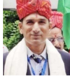
और भारत सरकार के रक्षा मंत्री राजनाथ

25 देशों का समर्थन प्राप्त अंतर्राष्ट्रीय समारोह मंच और इंडो नेपाल ऑर्गेनाइजेशन द्वारा देश-विदेश की प्रतिभाओं का महासम्मेलन के उपलक्ष्य में भारत की ओर से सम्मिलित होने पर भारत के पड़ोसी देश नेपाल की राजधानी काठमांडू में होने वाले अंतर्राष्ट्रीय महाकूभ में नेपाल सरकार के उपराष्ट्रपति न्यायार्थि परमानंद झा