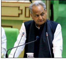
शाहपुरा और नीम का थाना। जबकि बांसवाड़ा, पाली और सीकर को संभाग बनाया गया है।

ये बने नए जिले -अनुपगढ़, ब्यावर, बालोतरा, डींग, डीडवाना, दुदु, गंगापूर सीटी, जयपुर उत्तर, जयपुर दक्षिण, जोधपुर पूर्व, जोधपुर पश्चिम, केकड़ी, कोटपुतली, बहरोड़, खैरथल, फलोदी, सलुंवर, सांचौर,