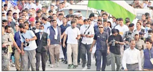
की बात कर रहे हैं। आज देश में बेरोजगारी, महंगाई, भ्रष्टाचार चरम पर है ,लेकिन बीजेपी के लोग हमेशा लड़ाने की बात करते हैं।