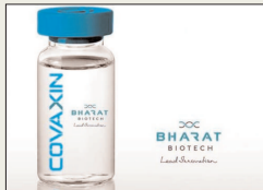
डब्ल्यूएचओ कोवैक्सिन की समीक्षा कर रहा है। डब्ल्यूएचओ के दिशा निर्देशों के अनुसार प्रक्रिया के तहत नए या बगैर लाइसेंस के उत्पादों के इस्तेमाल को मंजूरी

नई दिल्ली (हमारा वतन) विश्व स्वास्थ्य संगठन जल्द ही भारत बायोटेक की कोविड-19 वैक्सीन कोवैक्सिन के लिए आपातकालीन मंजूरी पर अहम फैसला लेने वाला है। संगठन की प्रमुख वैज्ञानिक सौम्या स्वामीनाथन ने बताया कि कोवैक्सिन के इस्तेमाल के लिए मंजूरी आगामी 4-6 हफ्तों में दे दी जाएगी।