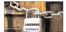
गाहड़लाइन वाले ही लागू रहेंगे।

जयपुर (हमारा वतन) कोरोना महामारी के बढ़ते मामलों को देखते हुए अशोक गहलोट सरकार ने प्रदेश भर में 10 मई सुबह 5 बजे से 24 मई तक सख्त लॉकडाउन लगाने का फैसला किया है। नए लॉकडाउन में शादी समारोहों पर रोक लगा दी है। शादी हो सकती है लेकिन केवल 11 लोग ही मौजूद रह सकेंगे। निजी वाहनों की तरह अब बसों सहित पब्लिक ट्रांसपोर्ट के सभी साधनों पर रोक लगा दी है। जिलों में आपातकालीन हालात को छोड़ आवाजाही पर रोक रहेगी। मनरेगा के काम बंद रहेंगे। नए लॉकडाउन में इन चार प्रावधानों के अलावा बाकी के प्रावधान 30 अप्रैल की